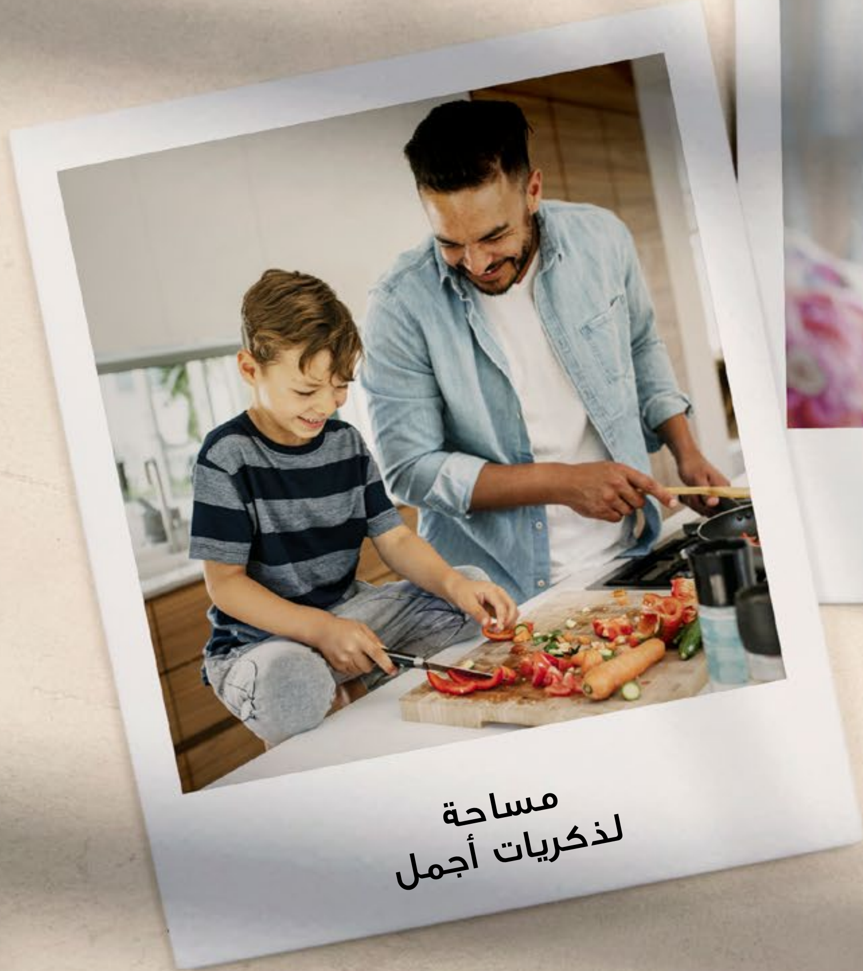
مساحة لذكريات أجمل