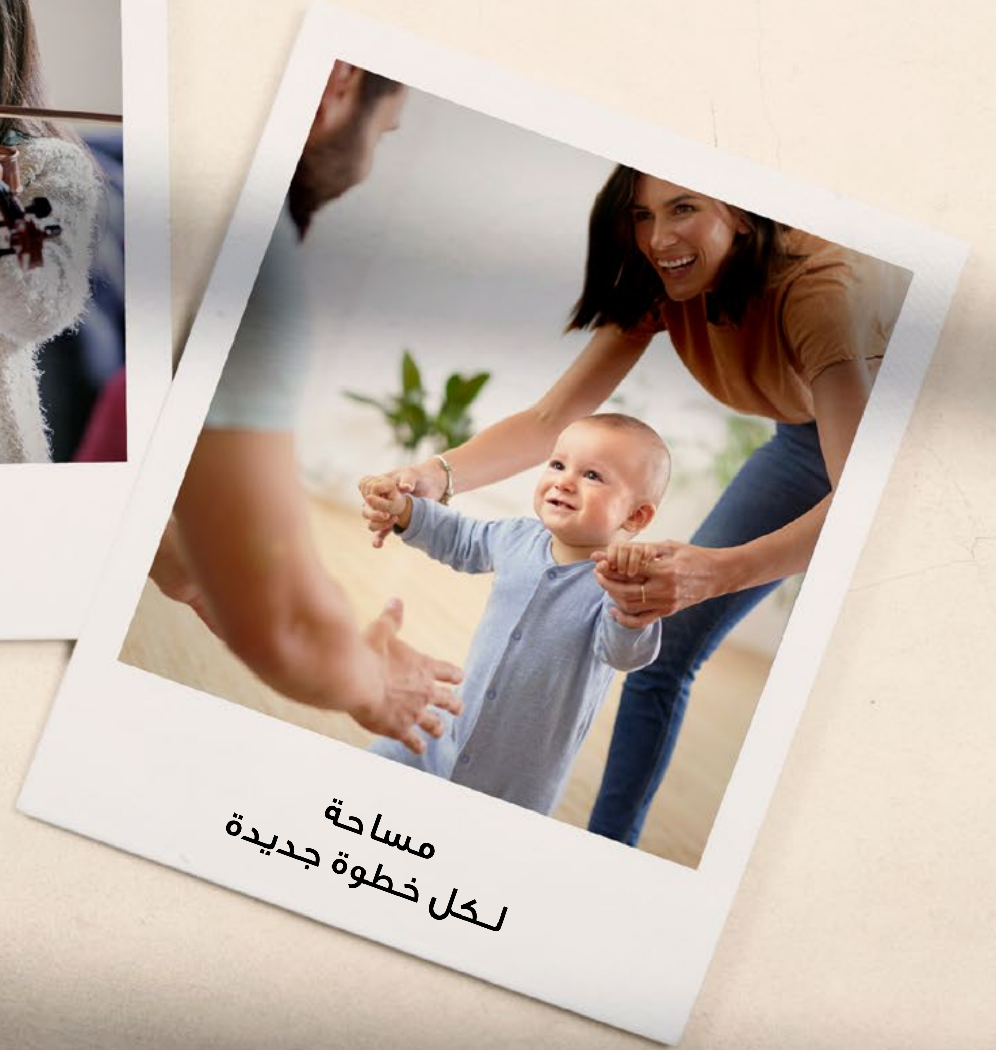
مساحة لكل خطوة جديدة