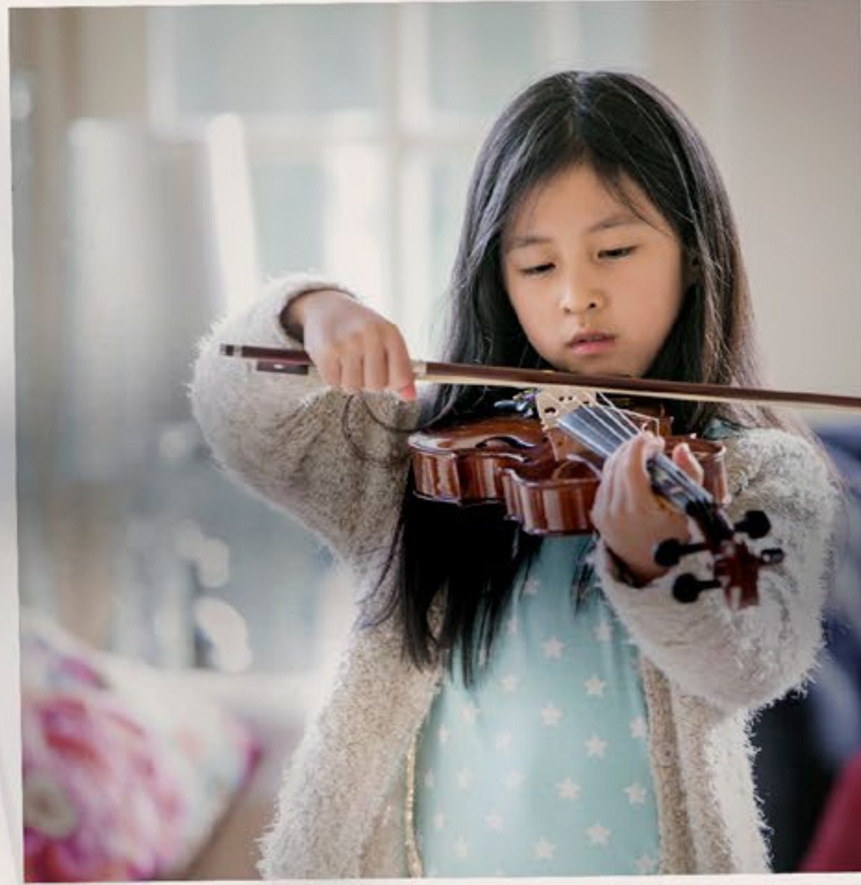
مساحة أكبر للحياة