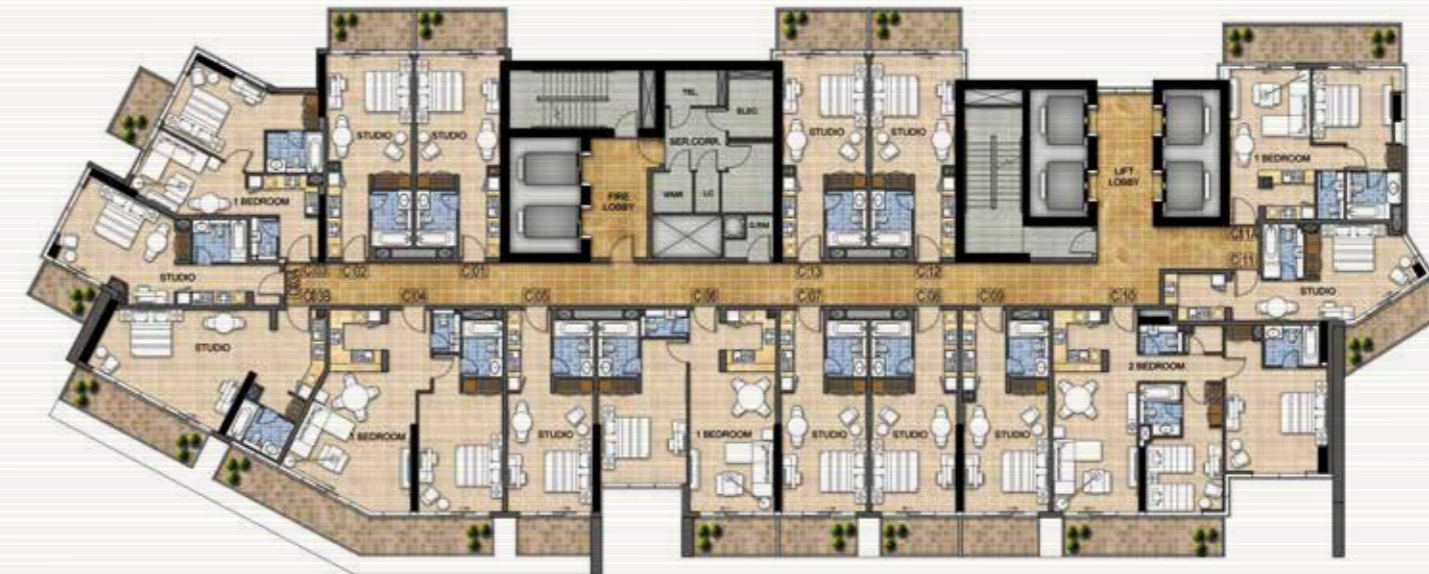
الطابق 14, 8