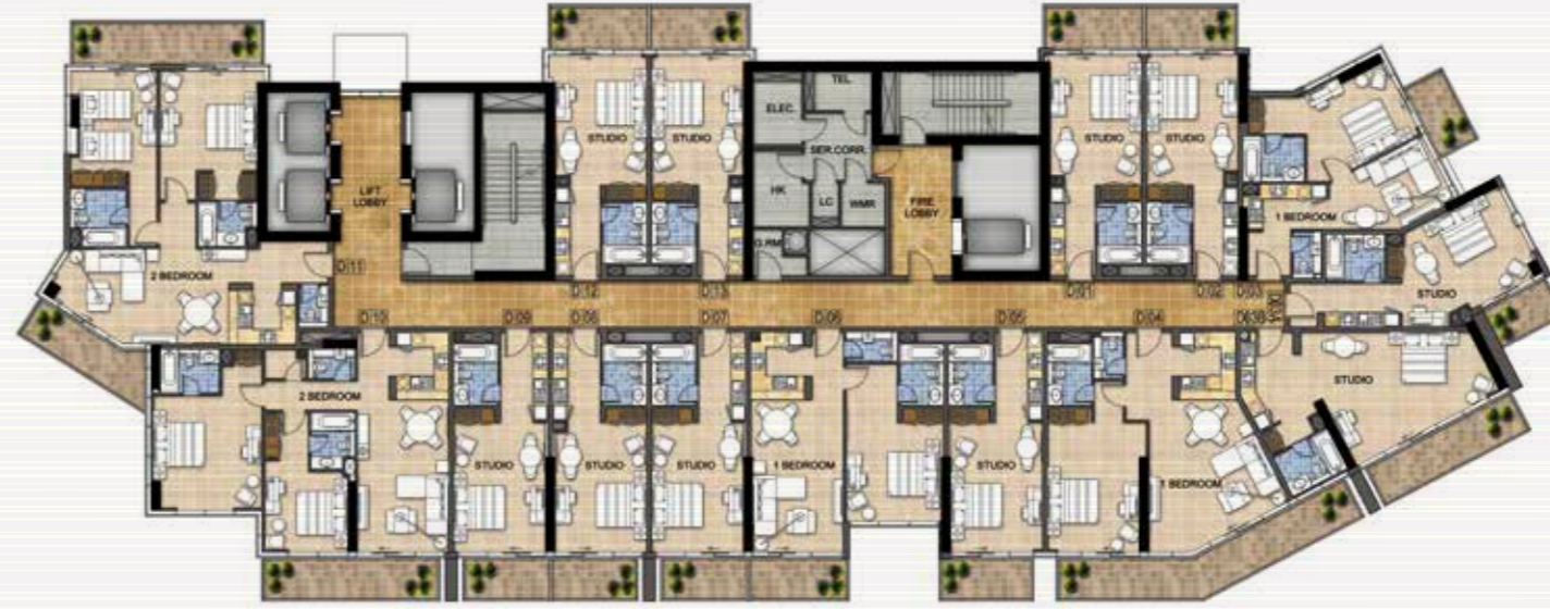
الطابق 6-4 12-9