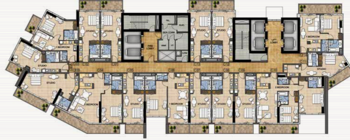
الطابق 7-4 10-9 13-12 15